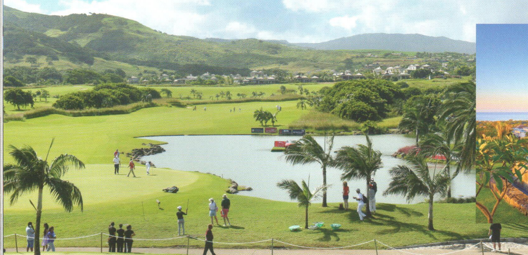
Rezidenční komplex Villas Valriche na Mauriciu je rájem pro golfové hráče.