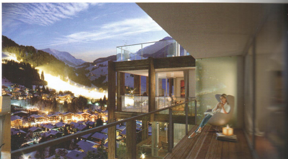
Rakousko, Švýcarsko, nebo Itálie? Alpy jsou stále oblíbeným místem, kam nákupy zahraničních realit směřuje mnoho Čechů.